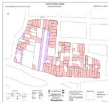
Figura 1. Ejemplo de representación.

Lista de requerimientos de Consulta interactiva por predio (con su manzana respectiva) requerido por el ciudadano, que comprenda los elementos