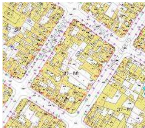
Sección urbana del plano predial digital

Eje vial: Vías de circulación para el tráfico, que por su importancia en cuanto a capacidad de tráfico y conexiones con puntos importantes, constituyen un eje de acceso a puntos de la ciudad.