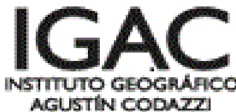
IMAGEN DEL PROYECTO