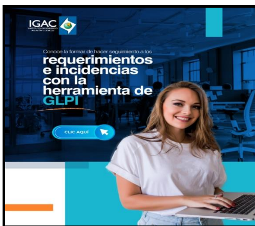
Ilustración No. 3 Requerimientos e incidencias – D.T Nariño Fuente: Área Sistemas D.T Nariño