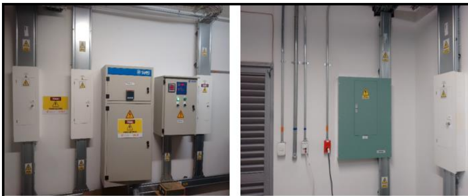
Ilustración No. 5 Cableado Estructurado – D.T Nariño