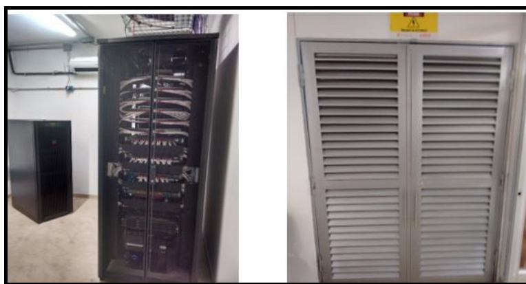
Ilustración No. 4 Servidores – D.T Nariño