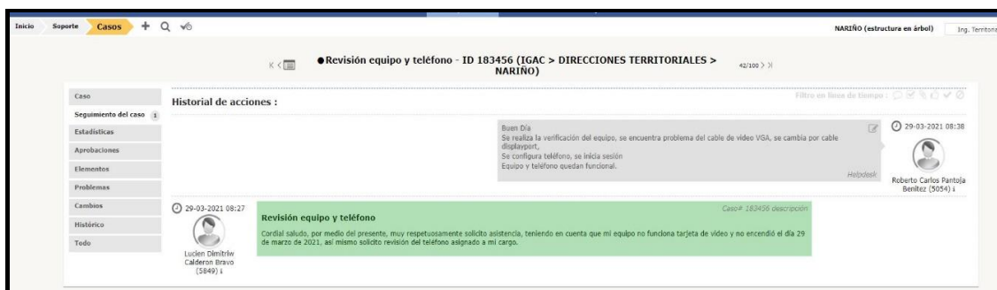
Ilustración No. 2 Aplicativo GLPI – D.T Nariño

Las solicitudes que se reciben por otro medio diferente a GLPI se solicita al usuario que sean reportadas en el aplicativo de GLPI. Se realiza el seguimiento permanente a las incidencias reportadas. Inventario de equipos de cómputo y dispositivos, a continuación, se ilustra un pantallazo del aplicativo: