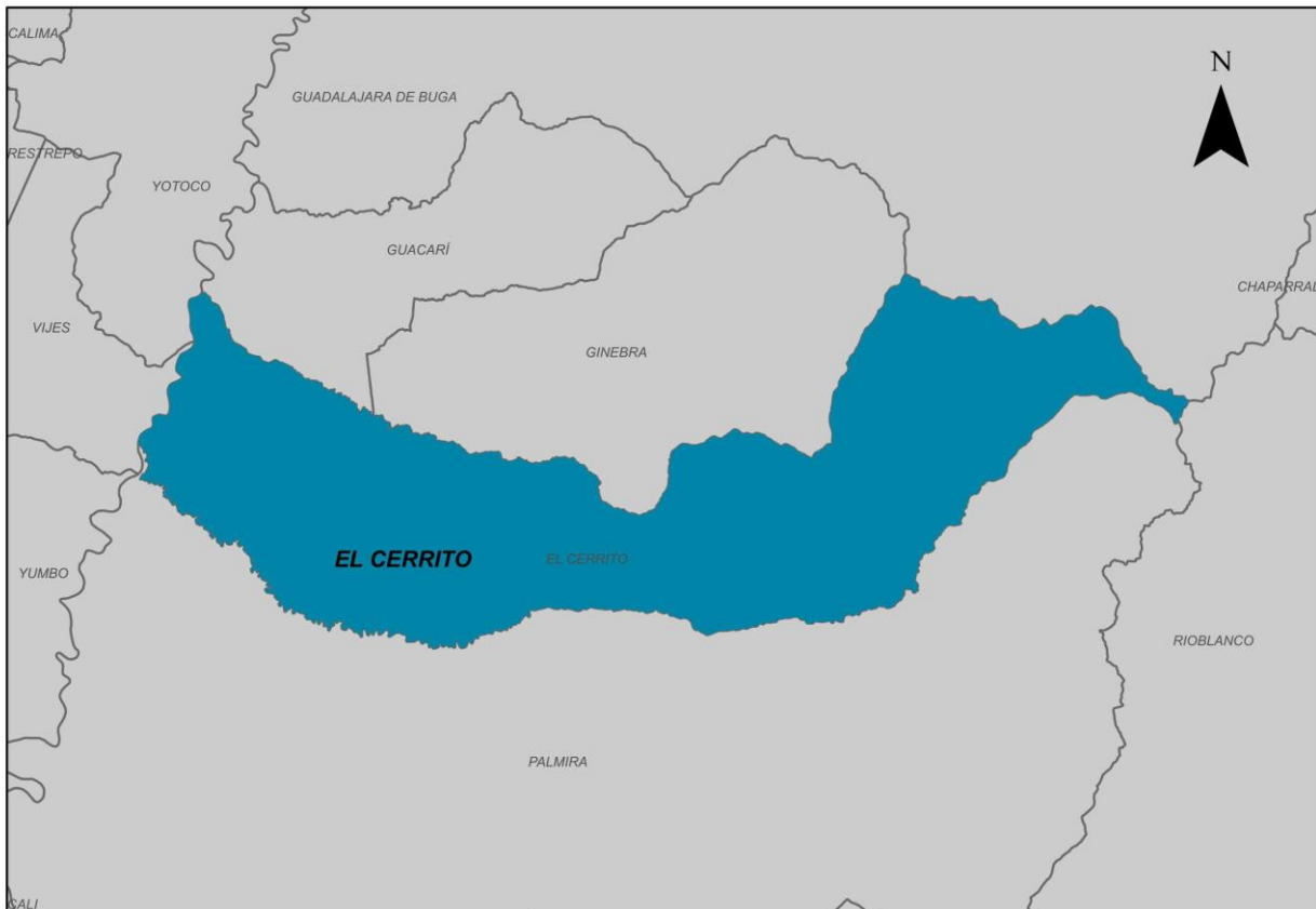
Ilustración 2. Municipio de El Cerrito