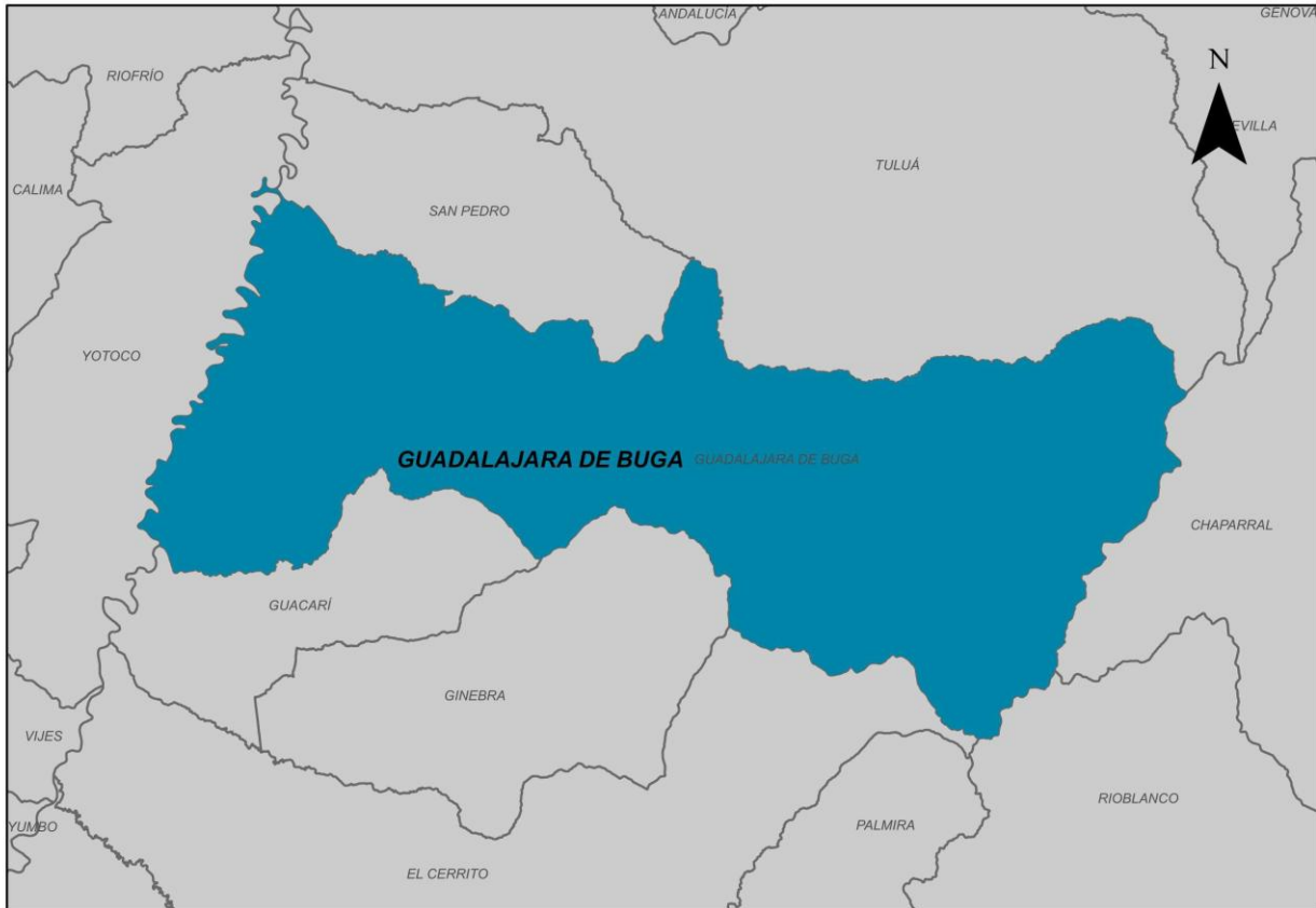
Ilustración 2. Municipio de Guadalajara De Buga