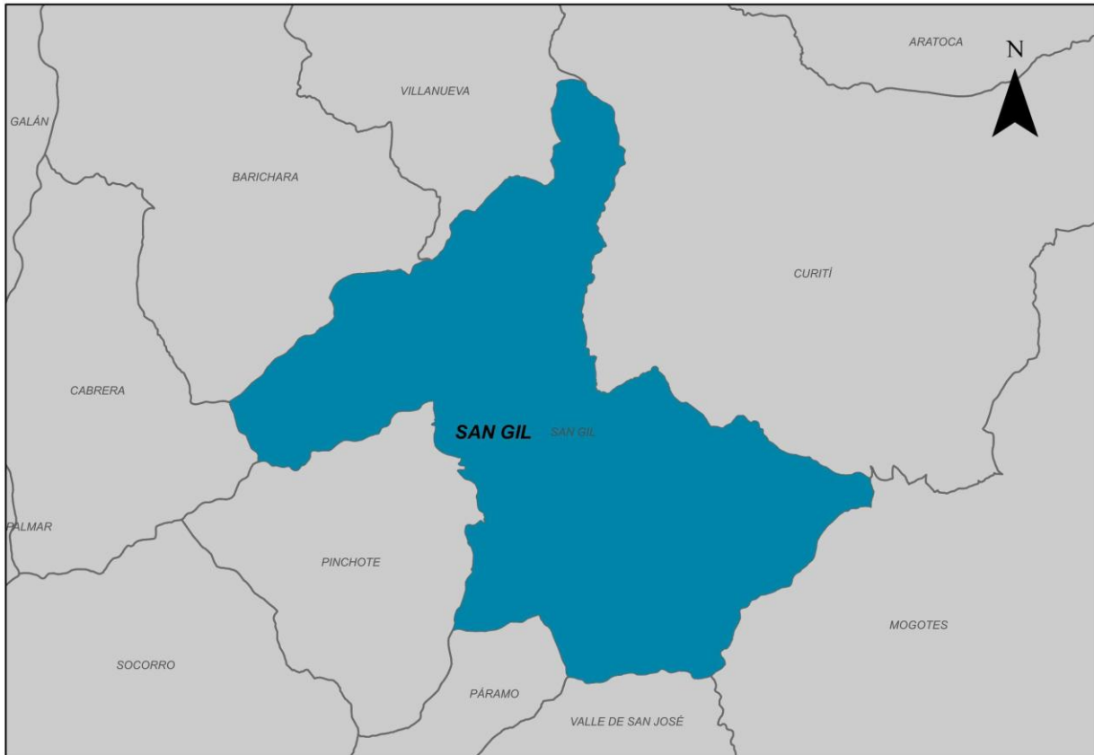
Ilustración 2. Municipio de San Gil