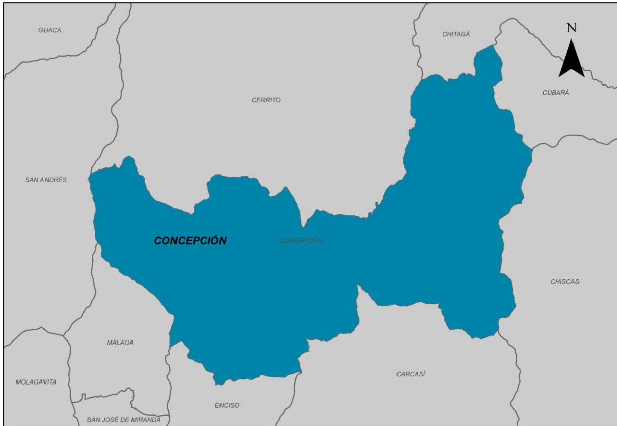
Ilustración 2. Municipio de Concepción