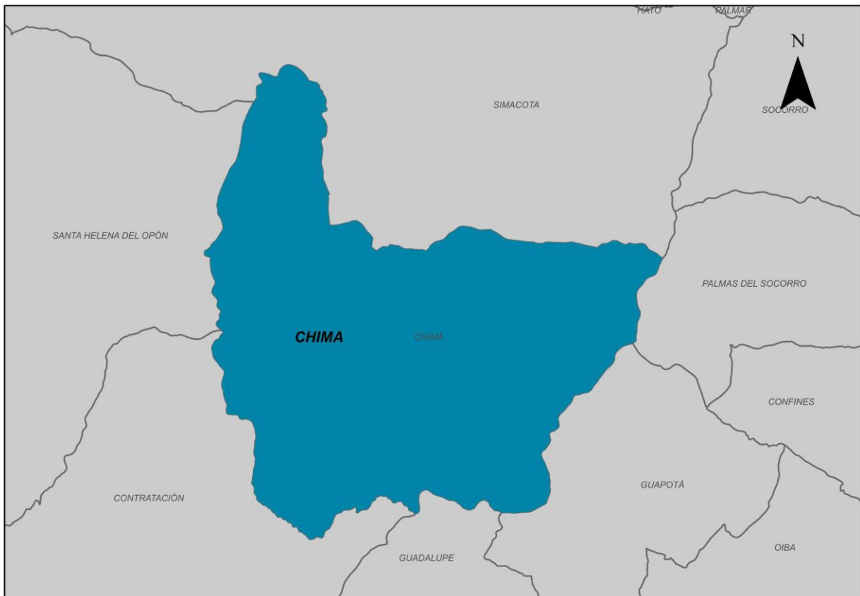
Ilustración 2. Municipio de Chima