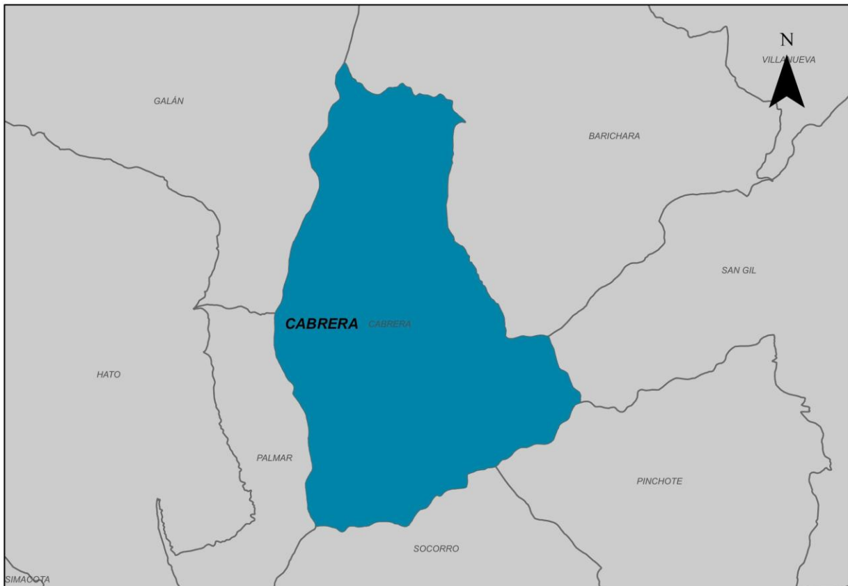
Ilustración 2. Municipio de Cabrera