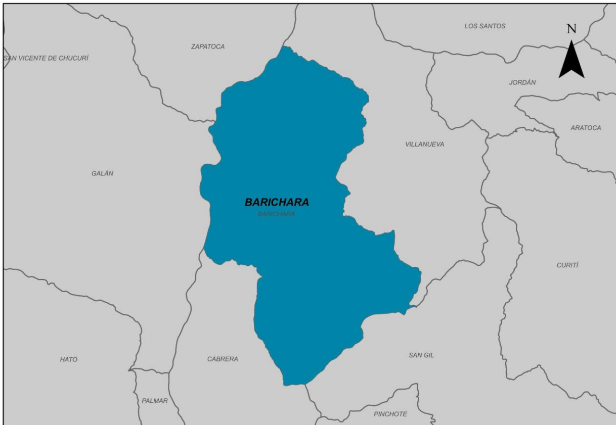
Ilustración 2. Municipio de Barichara