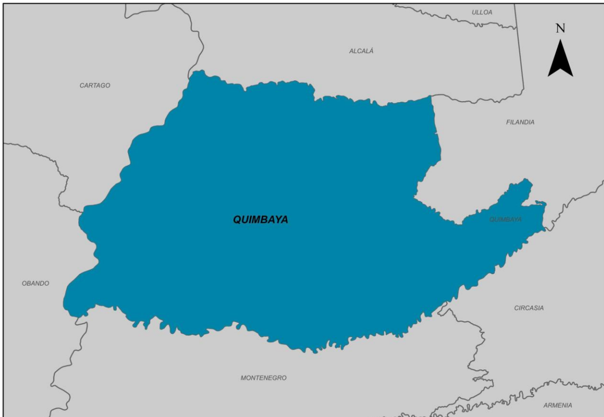
Ilustración 2. Municipio de Quimbaya