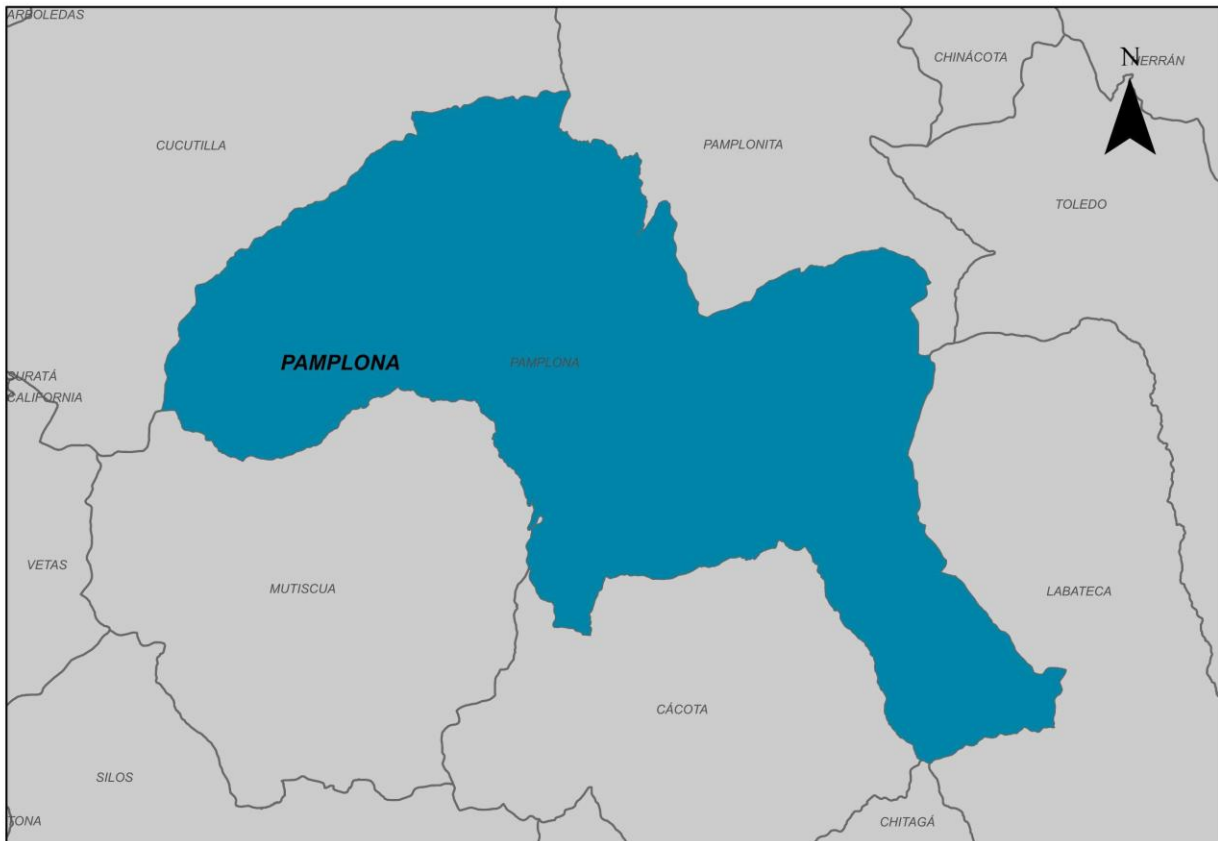
Ilustración 2. Municipio de Pamplona