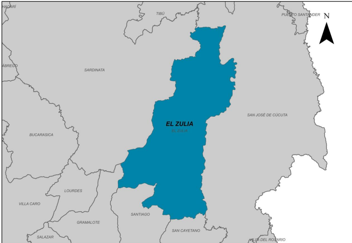
Ilustración 2. Municipio de El Zulia