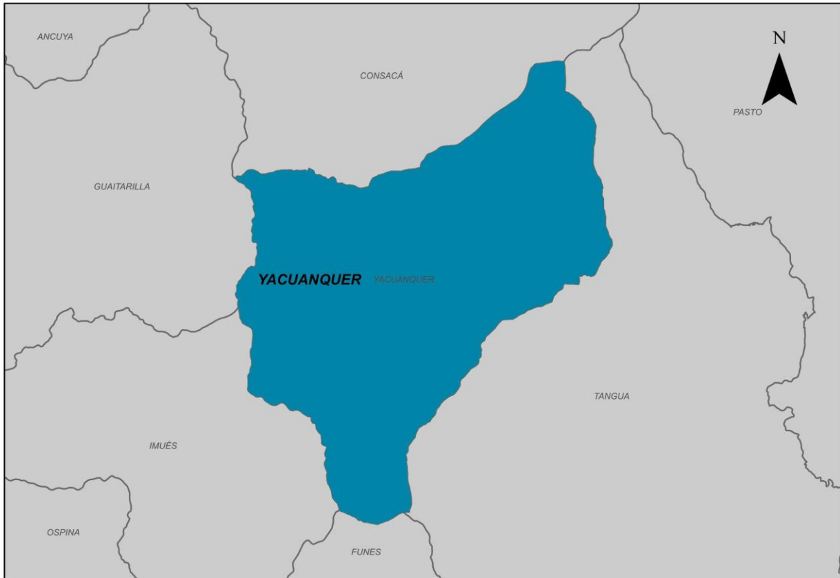
Ilustración 2. Municipio de Yacuanquer