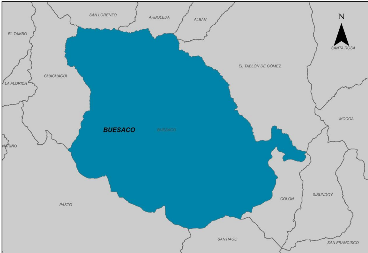
Ilustración 2. Municipio de Buesaco