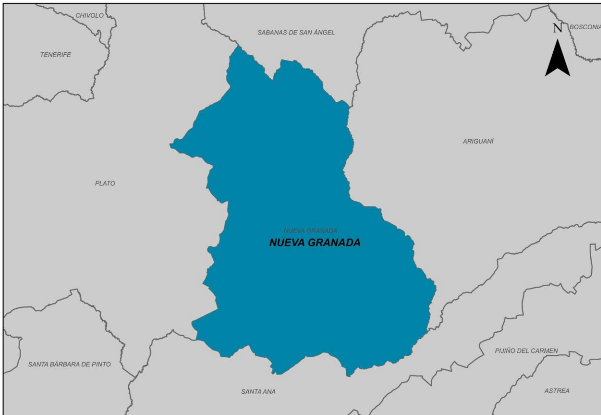
Ilustración 2. Municipio de Nueva Granada