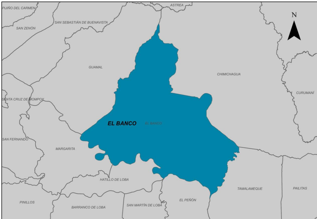
Ilustración 2. Municipio de El Banco