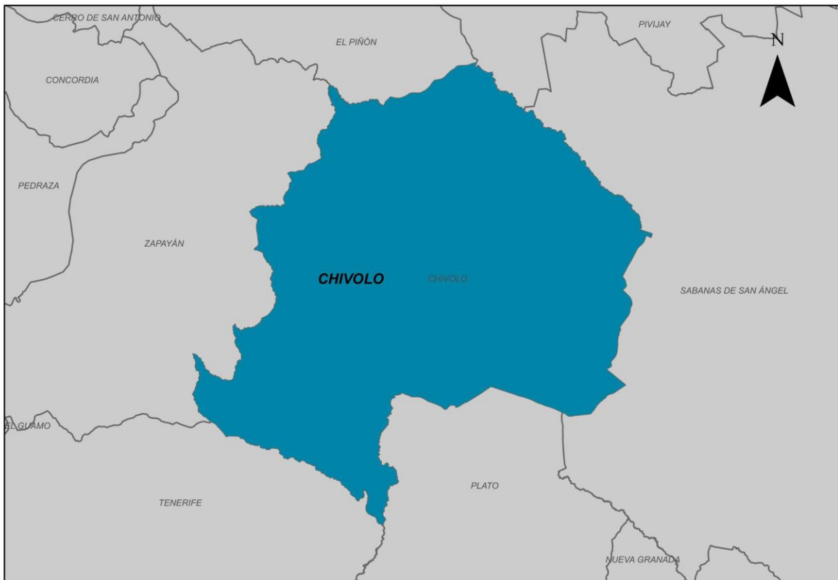
Ilustración 2. Municipio de Chivolo