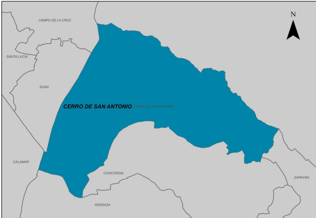
Ilustración 2. Municipio de Cerro De San Antonio