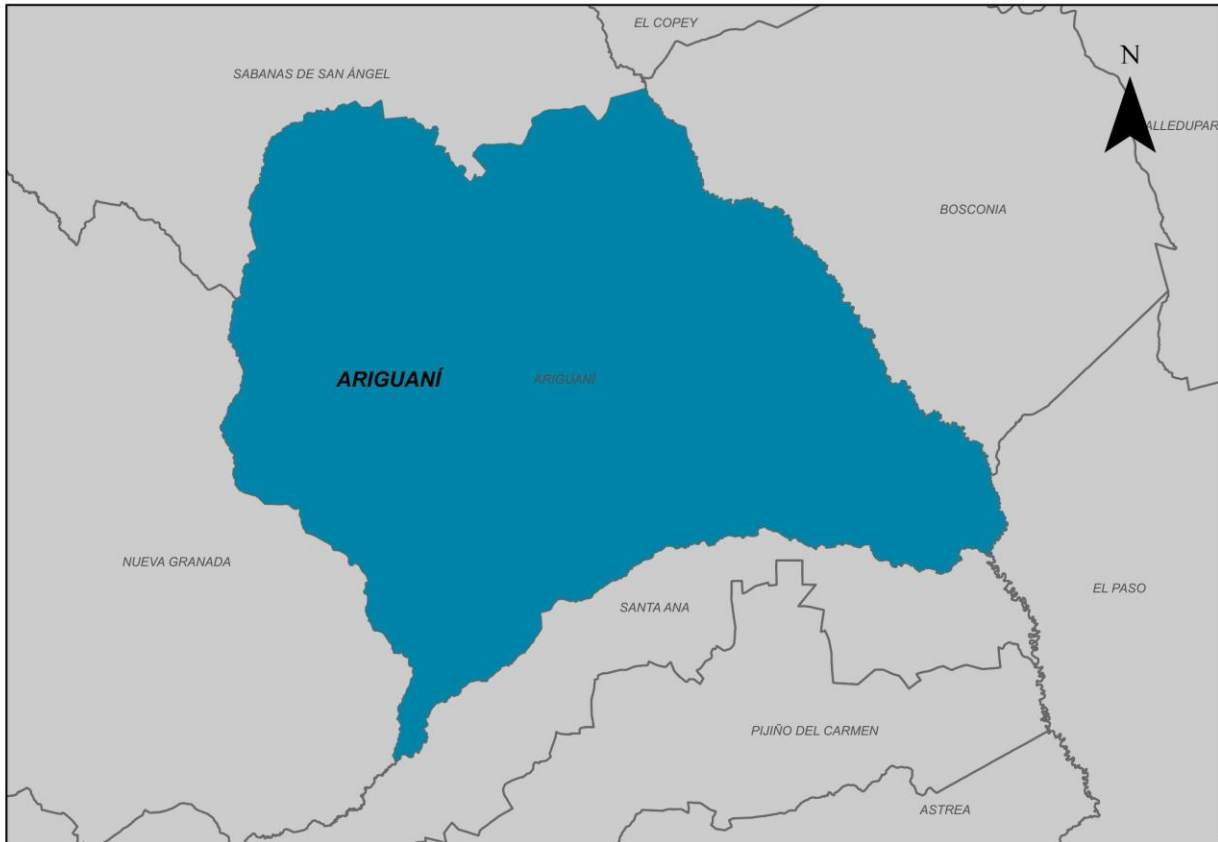
Ilustración 2. Municipio de Ariguani