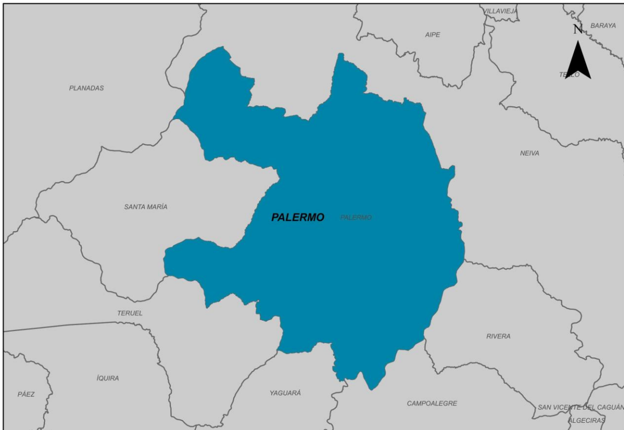
Ilustración 2. Municipio de Palermo