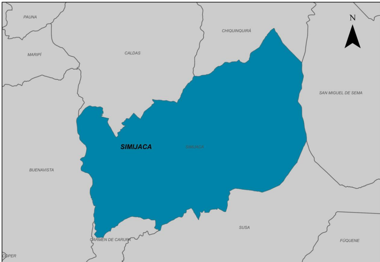
Ilustración 2. Municipio de Simijaca