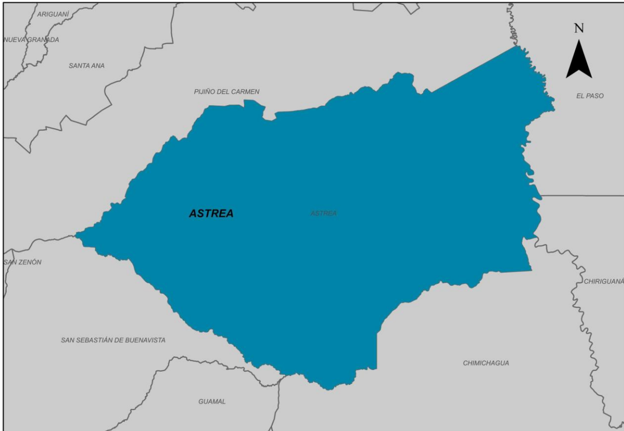
Ilustración 2. Municipio de Astrea