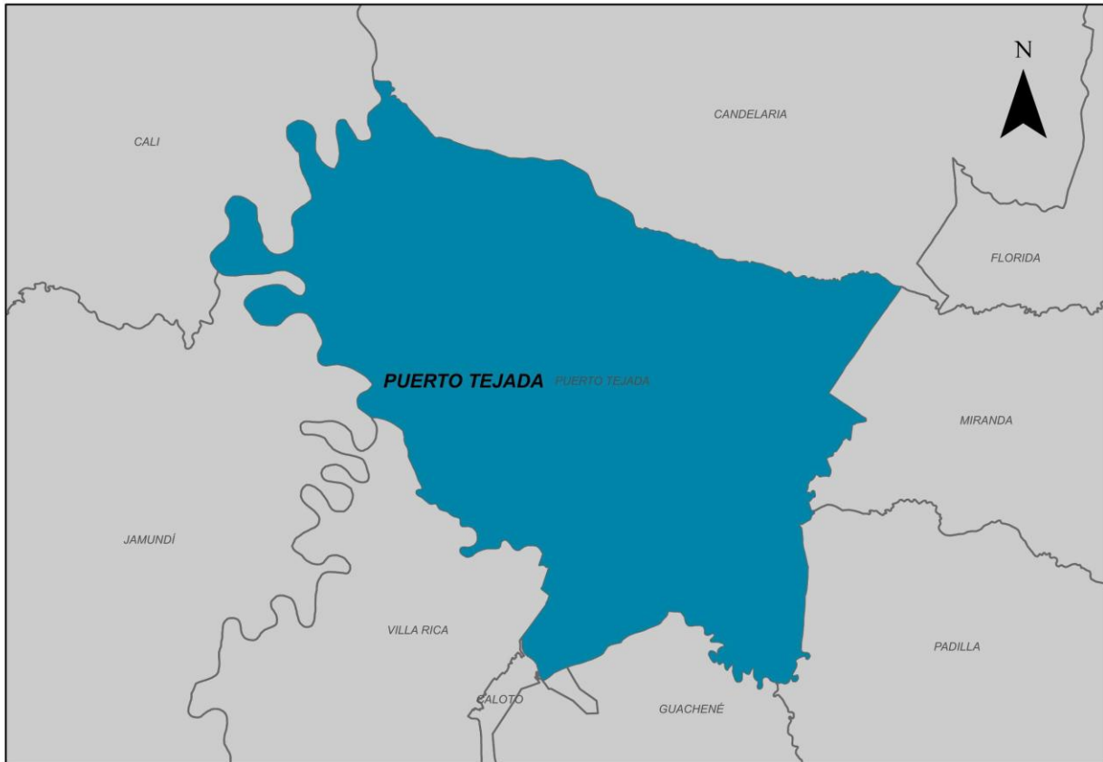
Ilustración 2. Municipio de Puerto Tejada