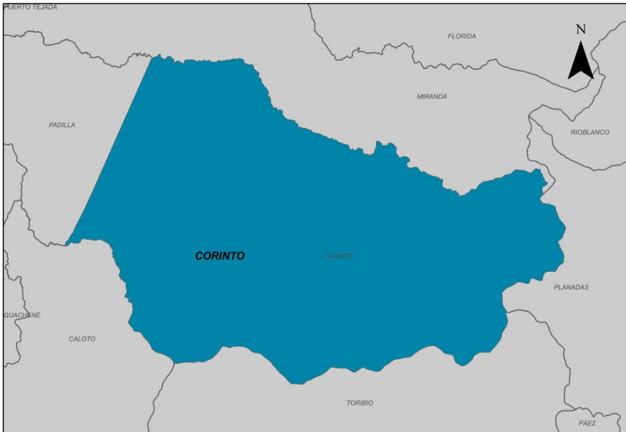
Ilustración 2. Municipio de Corinto