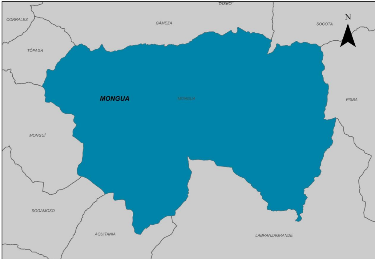
Ilustración 2. Municipio de Mongua