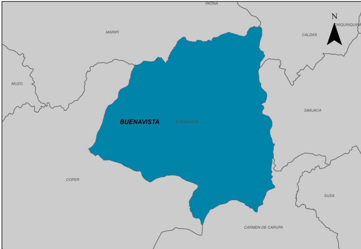
Ilustración 2. Municipio de Buenavista