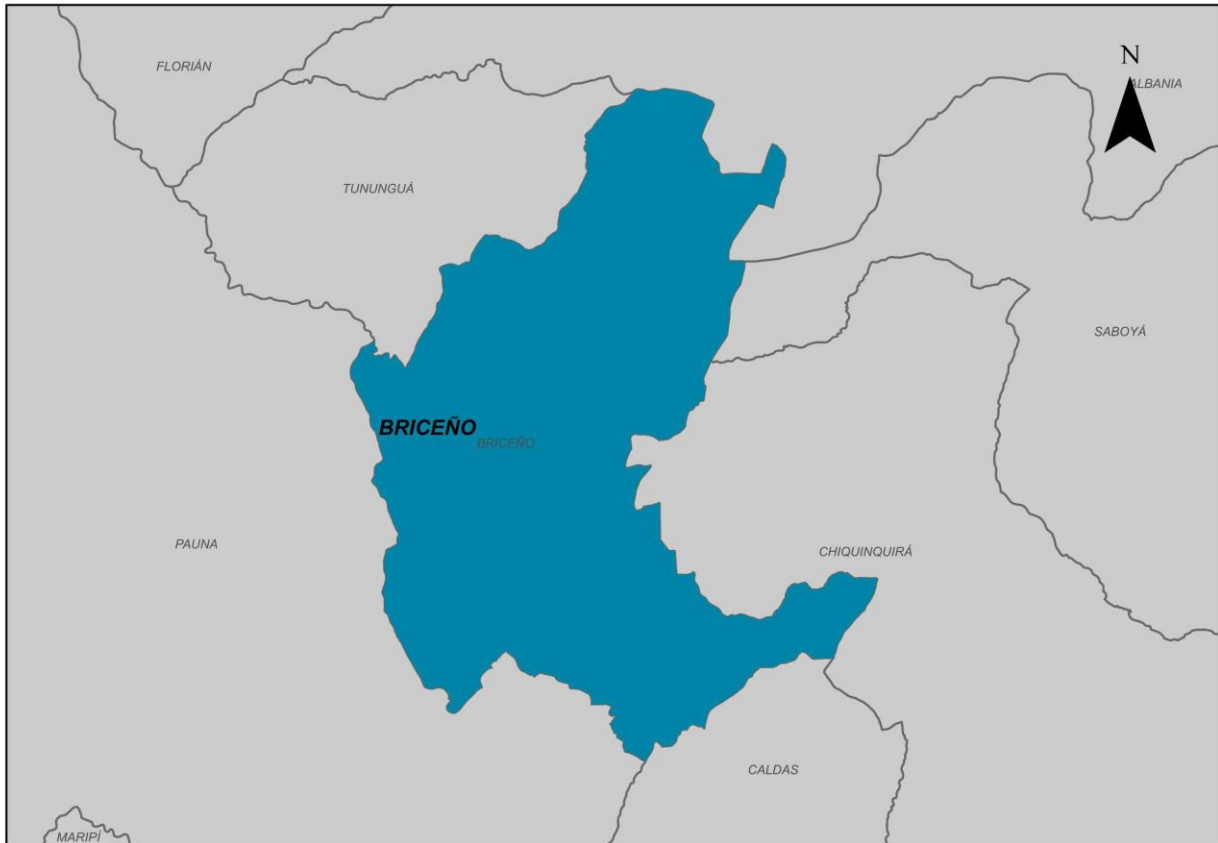
Ilustración 2. Municipio de Briceño