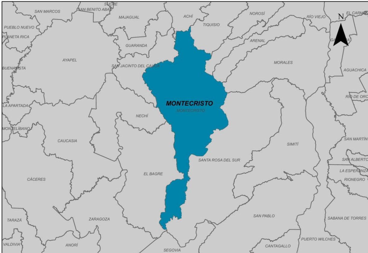
Ilustración 2. Municipio de Montecristo