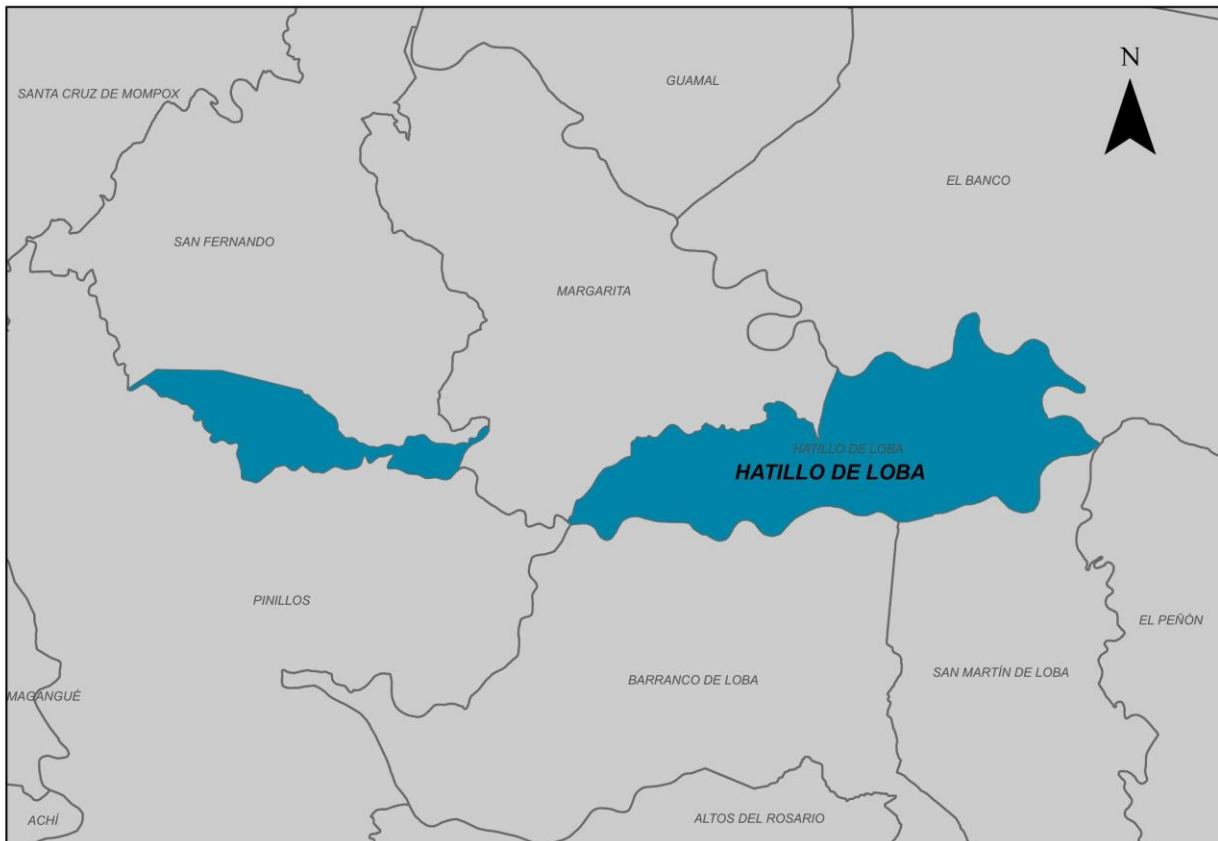
Ilustración 2. Municipio de Hatillo De Loba