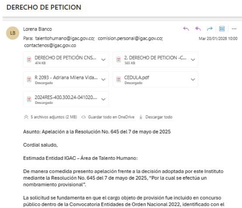
Imagen No. 1. derecho de petición