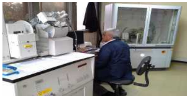
Fotografía. Proceso analítico en el Laboratorio Nacional de Suelos

Participación en la reunión grupo técnico binacional Ecuador Colombia como resultado de los grupos técnicos binacionales del acuerdo del 09-09-2013 en la ciudad de Pasto.